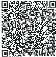
สิ่งที่ส่งมาด้วย ๑