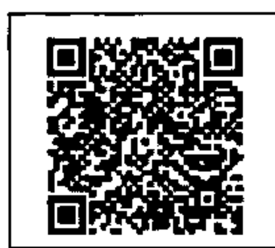
สิ่งที่ส่งมาด้วย ๒