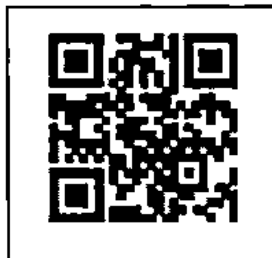
สิ่งที่ส่งมาด้วย ๔