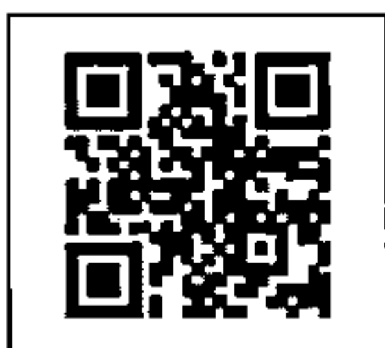
สิ่งที่ส่งมาด้วย ๑

กองระบบการคลังภาครัฐ กลุ่มงานบริการและประชาสัมพันธ์ โทรศัพท์ ๐ ๒๒๘๘ ๖๖๖๐ หรือ ๐ ๒๐๓๒ ๒๖๓๖ โทรศัพท์มือถือ ๐๘ ๓๔๓๐ ๒๗๒๒ ไปรษณีย์อิเล็กทรอนิกส์ gfmis1@cgd.go.th