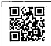
สิ่งที่ส่งมาด้วย ๒