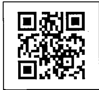
สิ่งที่ส่งมาด้วย ๖