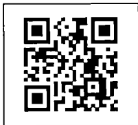
สิ่งที่ส่งมาด้วย ๔