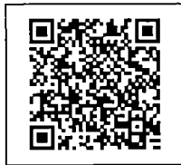
สิ่งที่ส่งมาด้วย ๕